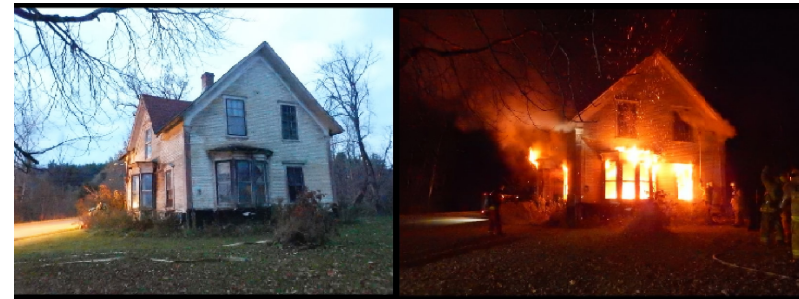
Les vieux bâtiments disparaissent de notre paysage d'Ogden par de nombreux moyens. Cette ancienne ferme de Lineboro datant des années 1880 a été rasée afin de former des pompiers volontaires.

Les Ogdenois sont chanceux de pouvoir profiter d'un aussi charmant paysage naturel. Il faut toutefois reconnaître que la beauté particulière de notre municipalité réside dans les aménagements créés par les différentes générations d'habitants. Citons les chemins abrités par des tunnels d'arbres, les champs et pâturages ainsi que ces belles demeures du 19e siècle qui apportent de la grâce au paysage ainsi qu'une trace de notre histoire. Cet héritage architectural qui nous est cher est toutefois en danger.